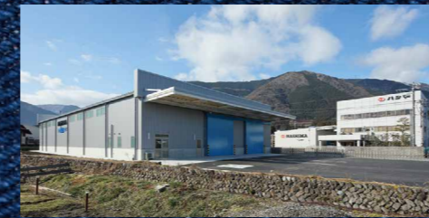
揖斐工場 IBI FACTORY