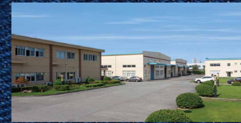
羽島(昆山)産業機器有限公司 HASHIMA KUNSHAN INDUSTRIAL EQUIPMENT CO.,LTD.