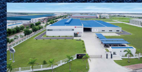
ベトナム工場 HASHIMA VIETNAM CO.,LTD.